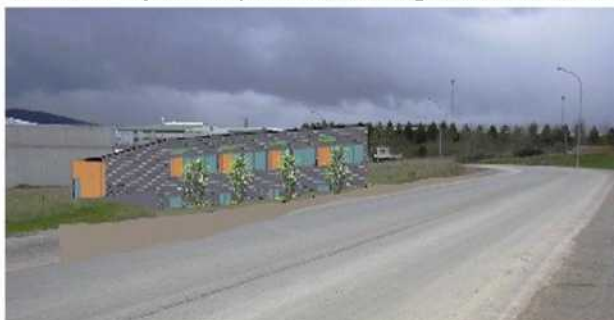
Vue de la façade rue portant les enseignes des locataires